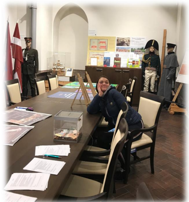
Ekskursiju organizēja un informatīvo materiālu sagatavoja vēstures skolotāja - Daina Spuriņa